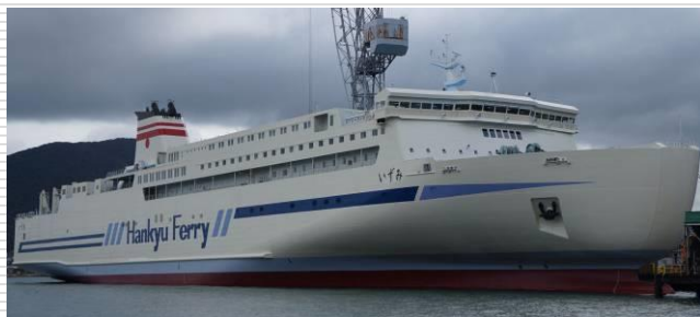
阪九フェリー いずみ