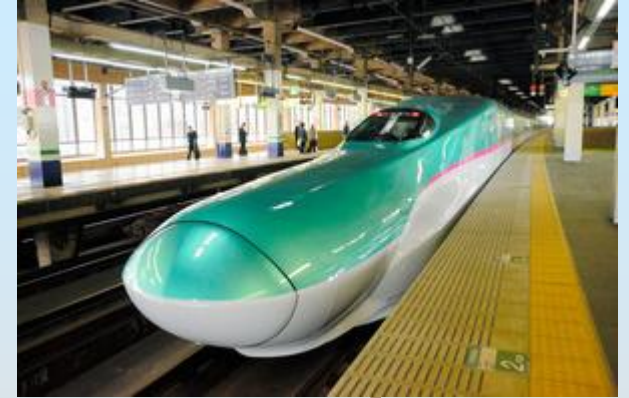
東北新幹線【はやぶさ】