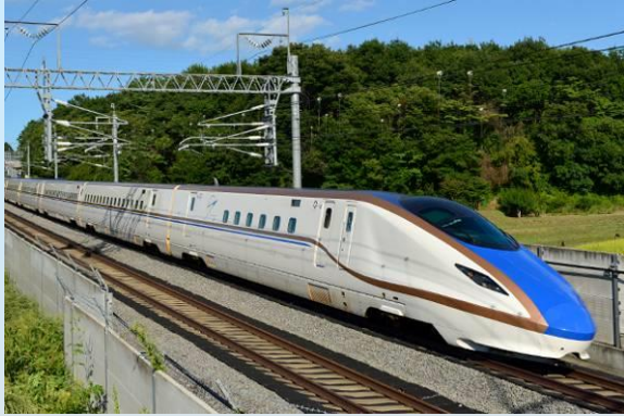
北陸新幹線【はくたか】