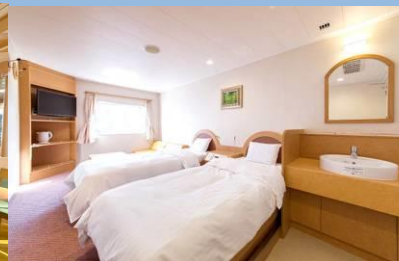
デラックス和洋室