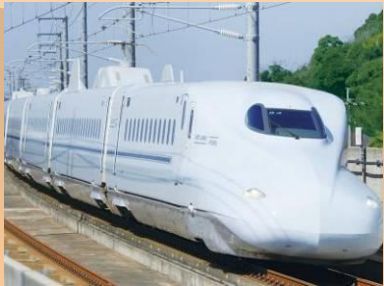
九州・山陽新幹線【さくら】