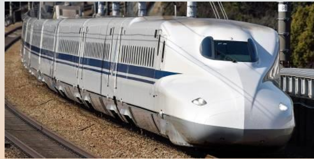
東海道新幹線【ひかり】