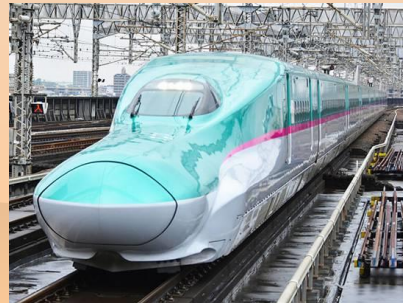
山形新幹線【つばさ】