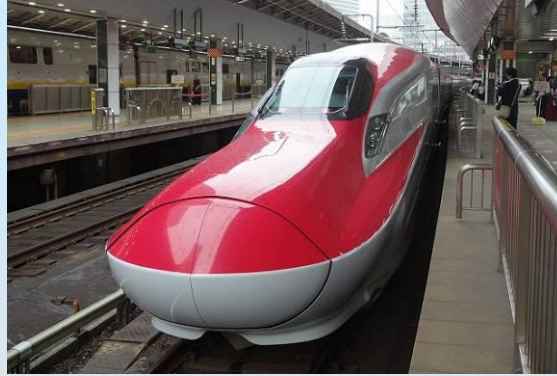
秋田新幹線【こまち】