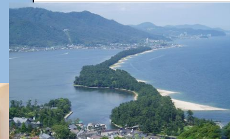
天橋立展望台より